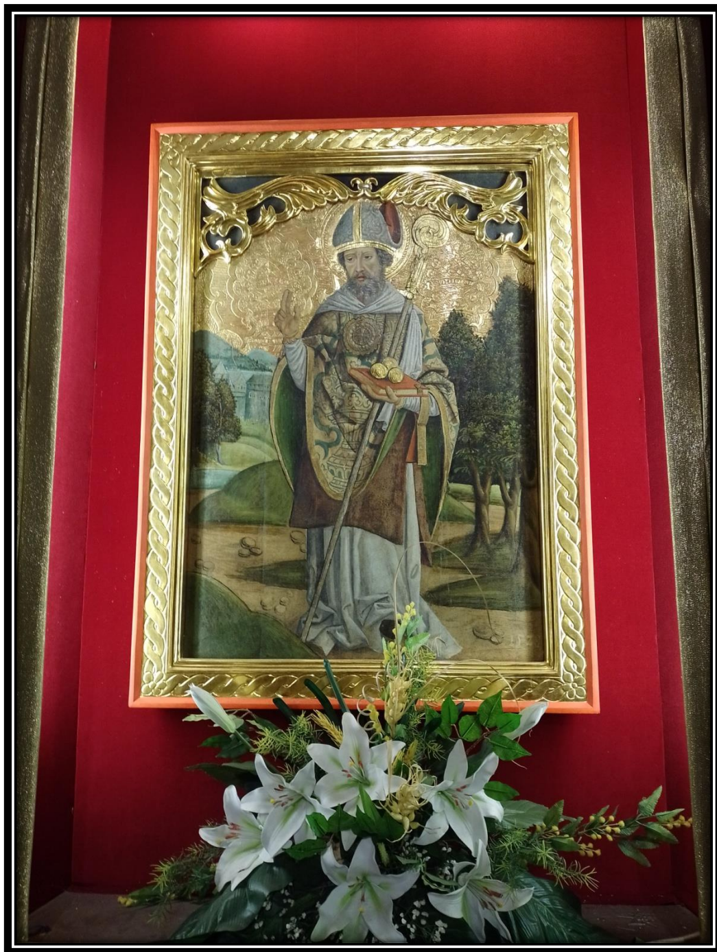
Zabytkowy obraz św. Mikołaja Biskupa znajdujący się w starym kościele w Jodłowej